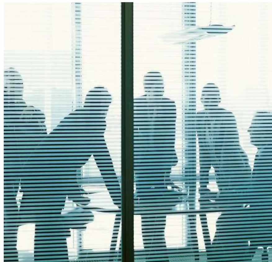
Der Bundesrat will mindestens 30% Frauen in Verwaltungsräten.

Frauenquoten sind aber nicht die einzigen Sorgen, die schweizerische Verwaltungsräte zurzeit umtreiben. Als belastend empfinden sie gemäss der Umfrage von Knight Gianella vor allem auch den zeitlichen Aufwand für die Verwaltungs-